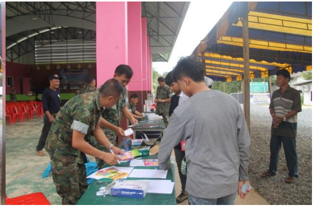
พิธีเปิดการฝึกกำลังประชาชนตำบลชายแดน