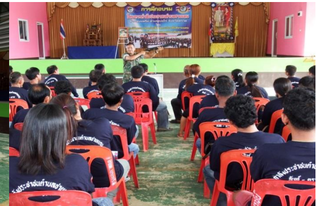
วิทยากรให้ความรู้เกี่ยวกับการปฐมพยาบาลเบื้องต้น/หน้าที่ อสม.