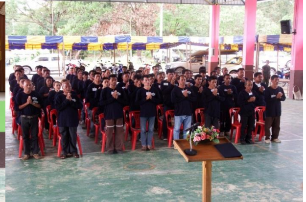
วิทยากรให้ความรู้เกี่ยวกับประชาชนตามแนวชายแดนกับยุทธศาสตร์เพื่อเสริมความมั่นคงของชาติ