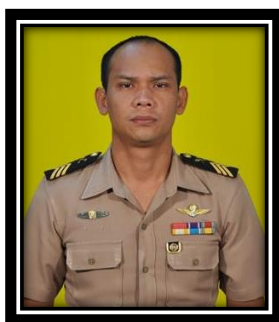
พ.จ.อ.จุฬา แจ่มจรัส