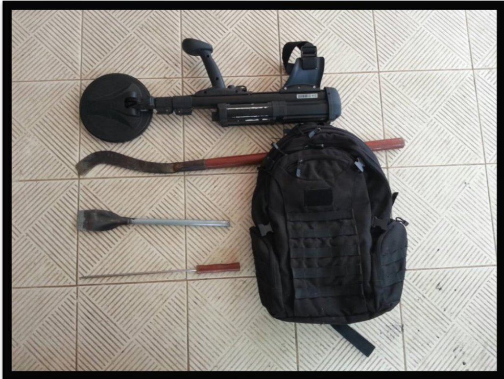
อุปกรณ์ที่ใช้ในการตรวจค้นวัตถุระเบิด (เครื่องตรวจค้นวัตถุระเบิด , เหล็กสกัด , เสียมเล็ก , มีดเดินป่า และ ถุงอุปกรณ์ชุดทำลาย)