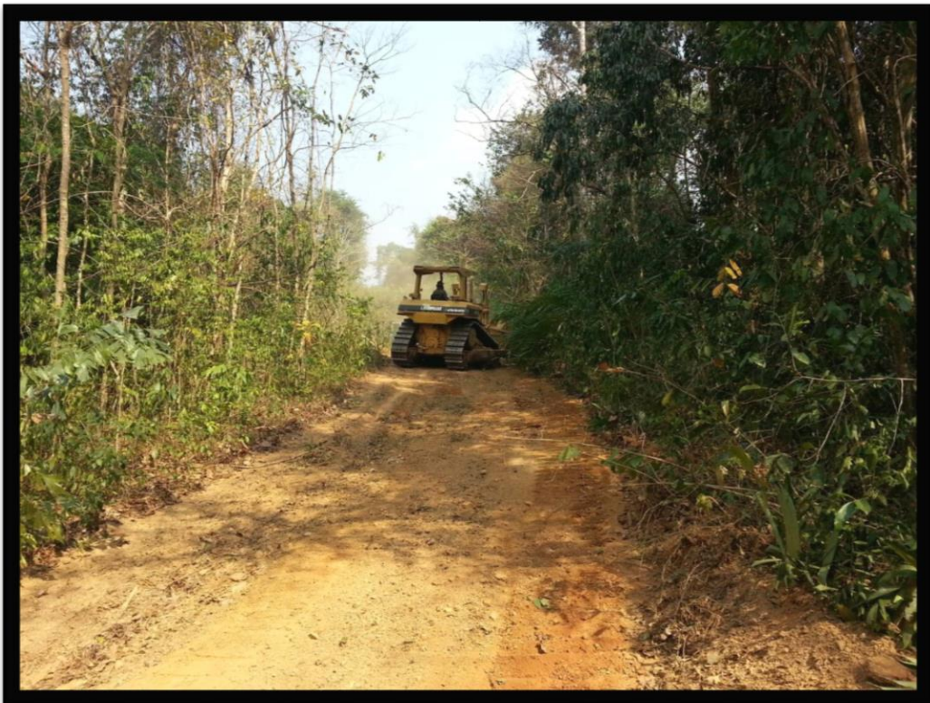
เครื่องมือกรตลากถางล้อยสายพาน