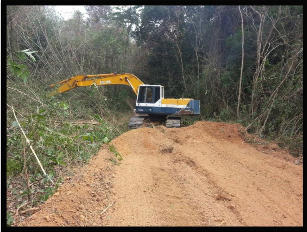
เครื่องมือกรขุดดินตะขาบ