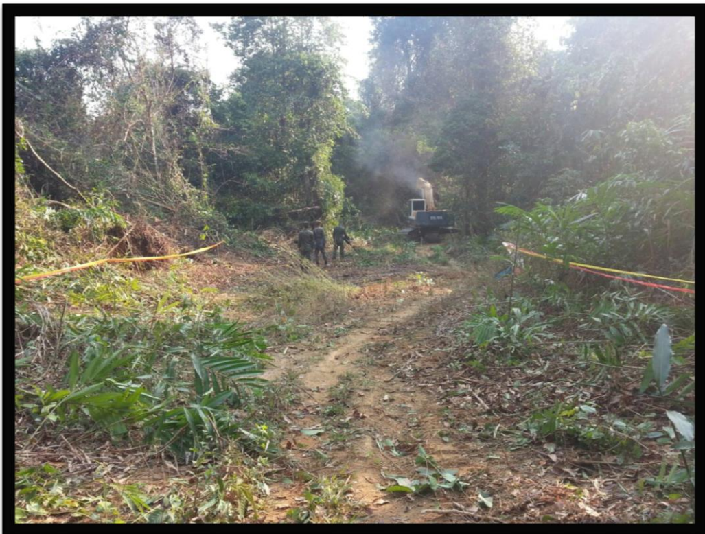
ขั้นตอนที่ 2 ให้เครื่องมือกลเข้าปรับปรุงเส้นทาง