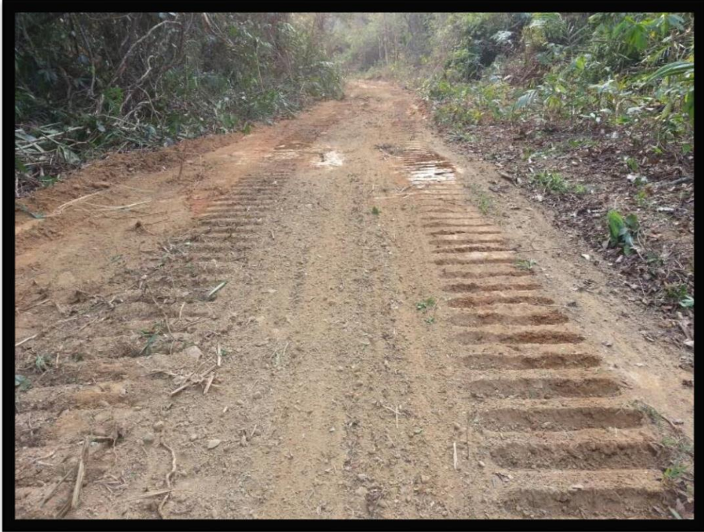
เส้นทางส่งกำลังบำรุงที่ปรับปรุงเส้นทางเสร็จเรียบร้อยแล้ว