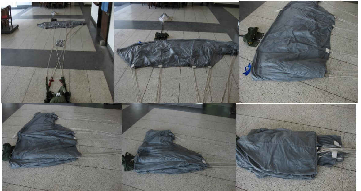
/๒. การพับผืนผ้าร่ม