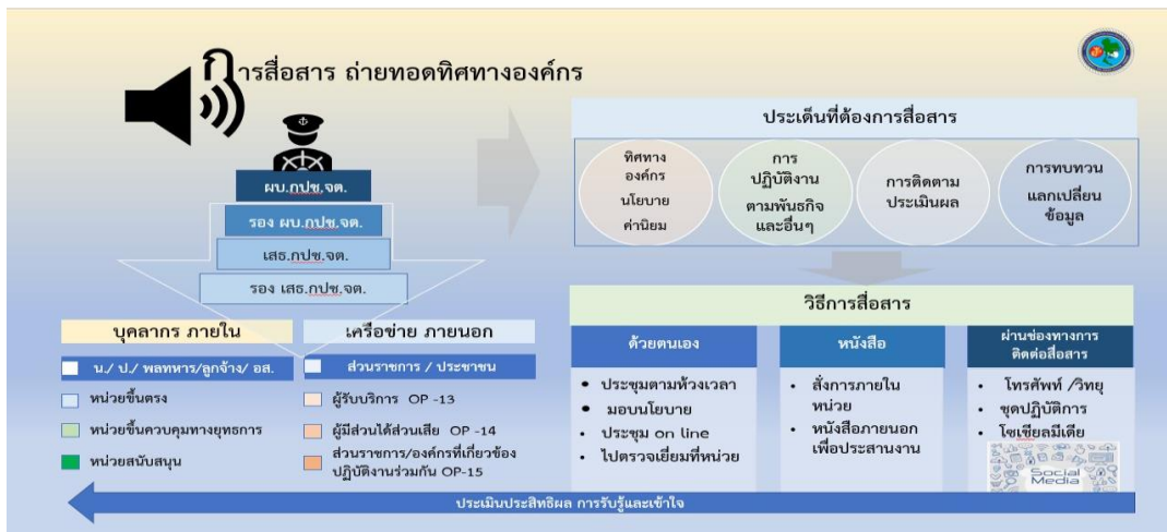
ภาพ 1-4 การสื่อสารถ่ายทอดทิศทางการองค์กร

ผบ.กปช.จต. รวมถึงผู้บริหารในระดับต่าง ๆ จะสื่อสารถ่ายทอดทิศทางการและสร้างความผูกพันตามภาพ 1-4 กับบุคลากรภายในของ กปช.จต. และกับผู้รับบริการที่สำคัญ (OP-13) และผู้มีส่วนได้ส่วนเสีย (OP-14) รวมทั้งส่วนราชการที่เกี่ยวข้องในการปฏิบัติงานร่วมกัน (OP-15) ผ่านวิธีการสื่อสารของหน่วยที่มีความหลากหลายแตกต่างกัน โดยแยกวิธีการสื่อสารออกเป็น 3 ลักษณะ คือ การสื่อสารด้วยตนเองของ ผบ.กปช.จต. และผู้บริหารระดับต่าง ๆ สื่อสารโดยการจัดทำหนังสือสั่งการภายในและประสานงานกับส่วนราชการภายนอก การสื่อสารผ่านช่องทางการติดต่อสื่อสารขององค์กร เช่น โทรศัพท์/โทรสาร วิทยุสื่อสาร สื่อโซเชียล Line website Facebook แบบสอบถาม ติดต่อโดยตรงกับชุดปฏิบัติการ โดยมีตัวชี้วัด (7.4 - 9.1) โดยเน้นการสื่อสารแบบ 2 ทาง Two - Way Communication เพื่อสร้างสภาพแวดล้อม สร้างความผูกพันกับบุคลากร ผู้รับบริการและผู้มีส่วนได้ส่วนเสีย ให้บุคลากรทั่วทั้งองค์กรมีส่วนร่วมในกิจกรรมที่สำคัญต่าง ๆ ในการขับเคลื่อนองค์กรให้บรรลุตามวิสัยทัศน์ที่กำหนดไว้ โดย ผบ.กปช.จต. รวมถึงทีมผู้บริหาร จะสื่อสารในเรื่องที่สำคัญ 4 ประเด็น คือ ทิศทาง นโยบายขององค์กร การปฏิบัติงานตามพันธกิจ และกิจกรรมอื่น ๆ การติดตาม ประเมินผล และการแลกเปลี่ยนข้อมูล ทบทวนการปฏิบัติเพื่อถอดบทเรียน นำไปพัฒนาปรับปรุง ซึ่งมีหัวข้อและช่องทางการติดต่อสื่อสารเพื่อสร้างการรับรู้ความเข้าใจ และสร้างความผูกพันของบุคลากรภายในองค์กร พันธมิตร ผู้รับบริการและผู้มีส่วนได้ส่วนเสีย กำหนดไว้ตามตาราง 1-3