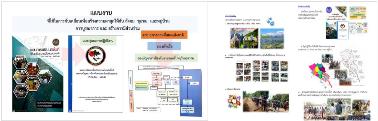
ภาพ 1-7 การนำแผนการพัฒนาพื้นที่ฯ ของ (สมช.) มาแปลงสู่การปฏิบัติ

ในการสร้างความผาสุกให้กับสังคม กองบัญชาการป้องกันชายแดนจันทบุรีและตราด ได้นำแผนการพัฒนาพื้นที่เพื่อเสริมความมั่นคงของชาติ ของสำนักงานสภาความมั่นคงแห่งชาติ สำนักงานนายกรัฐมนตรี มาถ่ายทอดเป็นแผนพัฒนาเพื่อเสริมความมั่นคงในพื้นที่เขต กปช.จต. (ตามภาพ 1-7) เพื่อใช้ในการขับเคลื่อนการทำงาน โดยบูรณาการกับส่วนราชการจังหวัดจันทบุรีและจังหวัดตราด ในรูปแบบของคณะกรรมการ เรียกว่า คณะกรรมการพัฒนาเพื่อความมั่นคงในระดับพื้นที่ในเขตกองบัญชาการป้องกันชายแดนจันทบุรีและตราด เรียกโดยย่อว่า “พมพ.กปช.จต.” มี ผบ.กปช.จต. เป็นประธานคณะกรรมการฯ