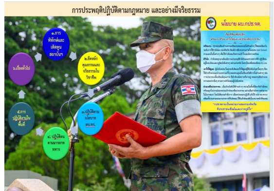
ภาพ 1-3 ผบ.กปช.จต. ประกาศเจตนารมณ์

ทางการปฏิบัติงานประจำปี ที่ยึดหลักคุณธรรมและจริยธรรมในวิชาชีพ โดย ผบ.กปช.จต. ประกาศเจตนารมณ์ ห้ามมิให้กำลังพลไปแสวงหาผลประโยชน์ใด ๆ ทั้งสิ้น ห้ามข้องเกี่ยวกับสิ่งผิดกฎหมายทั้งปวง เช่น ยาเสพติด สินค้าหนีภาษี แรงงานต่างด้าวหลบหนีเข้าเมือง การบุกรุกพื้นที่ป่าและการลักลอบตัดไม้ทำลายป่า (ตามภาพ 1-3) และเพื่อให้เกิดความชัดเจนและมุ่งมั่นต่อการบริหารงานตามหลักธรรมาภิบาล ตอบสนองต่อนโยบายของรัฐบาลในการสร้างราชการใสสะอาด ป้องกันการทุจริตคอร์รัปชัน ผบ.กปช.จต. จึงได้จัดให้มีระบบการจัดการเรื่องร้องเรียน ร้องทุกข์ จากผู้รับบริการและผู้มีส่วนได้ส่วนเสีย โดยมีหน่วยรับผิดชอบในการดำเนินการ 3 หน่วย ประกอบด้วย กพ.กปช.จต. กพร.กปช.จต. และ นธน.กปช.จต. ที่ผ่านมา กปช.จต. ไม่มีเรื่องร้องเรียนในการให้บริการ นอกจากนี้ ผบ.กปช.จต. ยังได้แสดงออกถึงการประพฤติตนเป็นแบบอย่างที่ดี (Role Model) ในการประพฤติปฏิบัติตามหลักนิติธรรม ความโปร่งใส และความมีจริยธรรม ตามตาราง 1-2