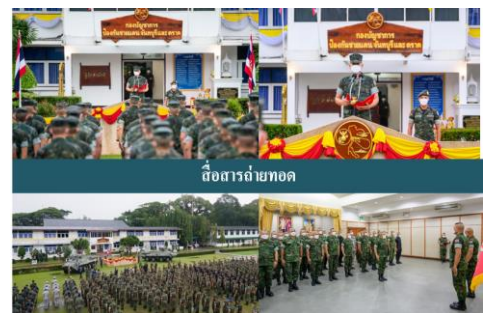
ภาพ 1-2 การสื่อสารถ่ายทอดวิสัยทัศน์ พันธกิจ

การถ่ายทอดวิสัยทัศน์ ยุทธศาสตร์ฯ (แผนปฏิบัติการ) ไปสู่การปฏิบัติ ดำเนินการผ่านนโยบาย ผบ.กปช.จต. ประจำปี รวมทั้งการนำเอาผลลัพธ์ที่ได้จากการประเมินผลการปฏิบัติงานปีงบประมาณที่ผ่านมาเป็นประเด็นสำคัญเพื่อทบทวน/ปรับปรุงการทำงานของหน่วย โดยกำหนดให้มีการประเมินผลการปฏิบัติเพื่อบรรลุยุทธศาสตร์ (แผนปฏิบัติการ) และวิสัยทัศน์ ทุกปีงบประมาณ โดยการประเมินติดตามตัวชี้วัดและค่าเป้าหมายที่กำหนดไว้ จากการประชุม นขต.กปช.จต. ประจำเดือน โดยมี ผบ.กปช.จต. เป็นประธานการประชุมฯ นับว่าเป็นกลไกสำคัญในการสื่อสาร ถ่ายทอด แบบ 2 ทิศทาง (Two - Way Communication) ของ ผบ.กปช.จต. หัวหน้าฝ่ายอำนวยการ รวมทั้งหัวหน้าหน่วยขึ้นตรง หน่วยขึ้นการควบคุมทางยุทธการ และหน่วยสนับสนุน ในการรับฟังข้อคิดเห็น ปัญหา อุปสรรค ข้อขัดข้อง ติดตามผลลัพธ์การดำเนินงานที่สำคัญ และการกำกับดูแลองค์การของคณะกรรมการต่าง ๆ ร่วมกัน ตลอดจนการตรวจเยี่ยมหน่วยในพื้นที่ปฏิบัติงานจริง ยังเป็นปัจจัยสำคัญที่ ผบ.กปช.จต. จะได้สื่อสารถ่ายทอดให้แนวทางการทำงานของหน่วยต่าง ๆ ได้เข้าใจทิศทางการขับเคลื่อนเพื่อบรรลุวิสัยทัศน์ พันธกิจที่ได้กำหนดไว้ (ตามภาพ1-2) สำหรับการกำหนดค่านิยมของ กปช.จต. นั้น ผบ.กปช.จต. มอบหมายให้ คณะกรรมการจัดทำยุทธศาสตร์ ดำเนินการระดมความคิด