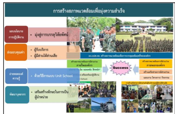
ภาพ 1-5 ผบ.กบช.จต. สร้างสภาพแวดล้อม

ในการสร้างสภาพแวดล้อมเพื่อมุ่งสู่ความสำเร็จขององค์กรนั้น ผบ.กบช.จต. ได้ให้ความสำคัญกับบุคลากรภายในองค์กร โดยมอบนโยบายการปฏิบัติงานให้กับคณะผู้บริหารของ กบช.จต. ฝ่ายอำนวยการทุกสายงาน และผู้บังคับหน่วยขึ้นตรงของ กบช.จต. หน่วยขึ้นการควบคุมทางยุทธการ และหน่วยสนับสนุน ได้เข้ามามีส่วนร่วมในการขับเคลื่อนองค์กร การส่งมอบผลผลิตและบริการ ร่วมแก้ปัญหา ตลอดจนร่วมกันรับผิดชอบต่อความสำเร็จตามนโยบายและแผนปฏิบัติราชการ (ภาพ 1-5) ซึ่งความสำเร็จจากการติดตามกำกับดูแลงานแต่ละด้าน ทั้งหน่วยงานที่มีหน้าที่รับผิดชอบและคณะกรรมการต่าง ๆ ที่แต่งตั้งขึ้น ส่งผลให้การดำเนินงานของ กบช.จต. ขับเคลื่อนไปทุกระดับอย่างมั่นคงและยั่งยืน ทั้งนี้ เพื่อส่งมอบคุณค่าที่ดีให้กับผู้รับบริการและผู้มีส่วนได้ส่วนเสียต่อไป โดยมีการสร้างสภาพแวดล้อมเพื่อมุ่งความสำเร็จ (ตามตาราง 1-4)