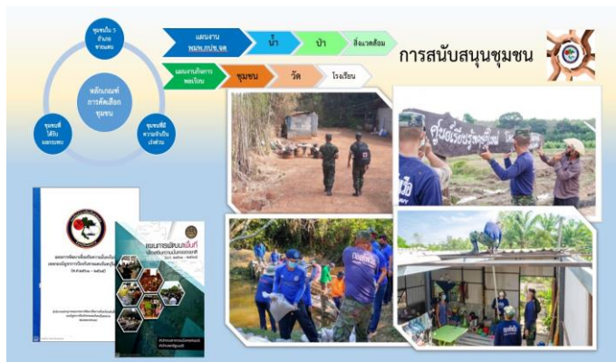
ภาพ 1-9 การสนับสนุนชุมชน

กปช.จต. ให้ความสำคัญกับชุมชนที่อาศัยบริเวณรอบหน่วยงาน/ชุมชนที่มีความสำคัญ โดยมีกระบวนการในการสนับสนุนและสร้างความเข้มแข็งให้แก่ชุมชนสำคัญของ กปช.จต. การเลือกชุมชนที่ให้การสนับสนุนจะใช้หลักเกณฑ์พิจารณาจาก 1) ชุมชนที่อยู่ใน 5 อำเภอชายแดน ที่ประสบปัญหาจากภัยธรรมชาติและขาดแคลนแหล่งน้ำ 2) ชุมชนที่อาจได้รับผลกระทบจากการปฏิบัติงานของ กปช.จต. 3) ชุมชนที่มีความจำเป็นที่ควรได้รับการสนับสนุนอย่างเร่งด่วน โดยใช้ชุดปฏิบัติการในพื้นที่เข้าไปสำรวจความต้องการและเปิดโอกาสให้ชุมชนมีส่วนร่วมในการแสดงความคิดเห็นและกำหนดกิจกรรมที่ต้องการ จากนั้น กปช.จต. ใช้ข้อมูลที่ได้รับนำมาพิจารณาความเหมาะสม กำหนดเป้าหมาย กลุ่มเป้าหมาย กิจกรรม และจัดทำแผนปฏิบัติการ เสนอผู้บริหารกำหนดนโยบายในการสนับสนุนชุมชนต่อไป ระหว่างการดำเนินการมีกระบวนการติดตามและประเมินผลการดำเนินงานอย่างต่อเนื่องและสม่ำเสมอตามแผนที่ได้กำหนดไว้ รวมทั้งมีการสำรวจทัศนคติ รับฟังความคิดเห็นข้อเสนอแนะของสังคม ชุมชน ภายหลังกการดำเนินกิจกรรมตามแผน โดยคณะทำงานและผู้รับผิดชอบรายงานผลการดำเนินงานให้ผู้บริหารระดับสูงทราบ ในการประชุมหน่วยขึ้นตรงประจำเดือน และประชาสัมพันธ์ผลการดำเนินงานให้หน่วยงานที่เกี่ยวข้องทราบ นอกจากนี้ ยังได้มีกระบวนการพิจารณา ทบทวนและเรียนรู้เพื่อปรับปรุงให้มีความเหมาะสมทันต่อสถานการณ์ อย่างน้อย ปีละ 1 ครั้ง จากการรับฟังความคิดเห็นของชุมชน